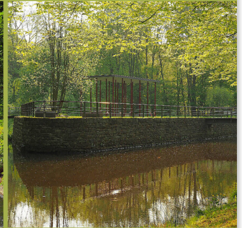
Gütersloh entlang der Dalke 2023